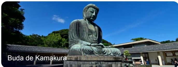
Buda de Kamakura