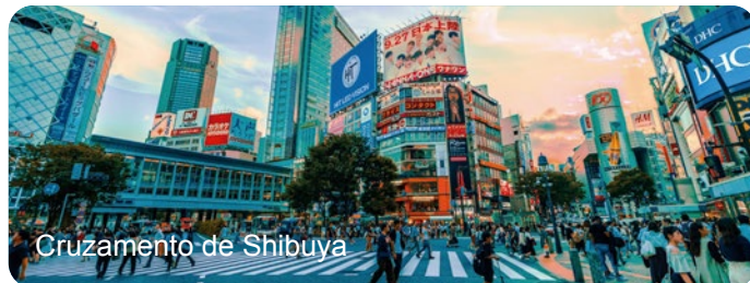
Cruzamento de Shibuya

Nota: Tempo livre durante a visita para almoçar.