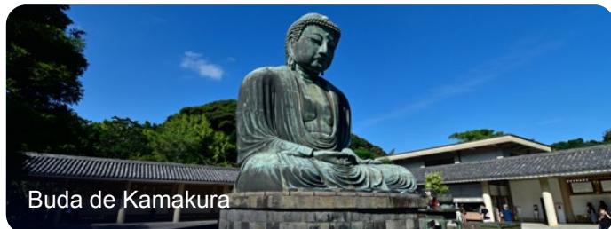
Buda de Kamakura