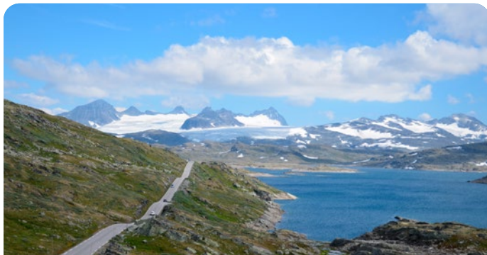
Skjolden, Noruega 4 de Agosto de 2026