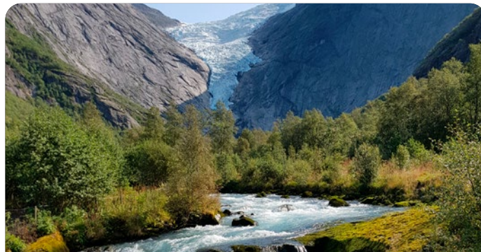
Olden, Noruega 5 de Agosto de 2026

- Sognefjell: Paisajes de Montaña y Glaciares